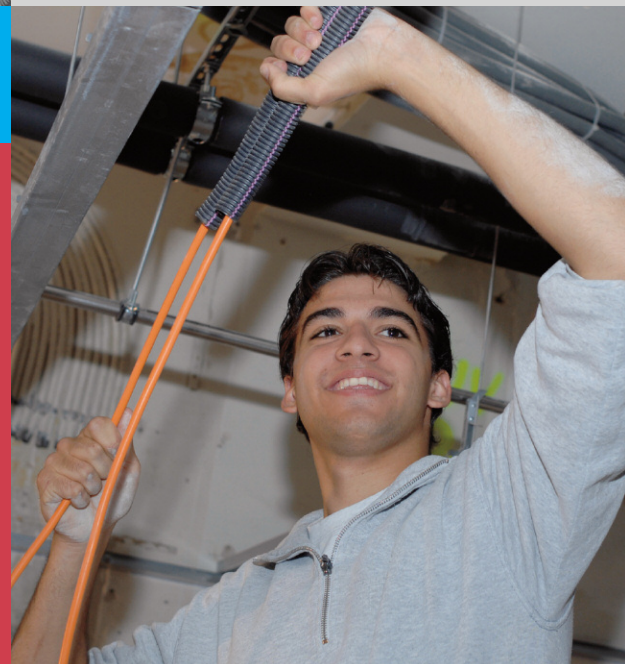
Atelier Herrmann S&G

Commission paritaire nationale CPN Weltpoststrasse 20 Case postale 272 3000 Berne 15 Tél. 031 350 22 65 Fax 031 350 23 77 e-mail elektrogewerbe@plk.ch page d'accueil www.cpn-electro.ch Union Suisse des Installateurs-Electriciens Secrétariat central Limmatstrasse 63 8005 Zurich Tél. 044 444 17 17 Fax 044 444 17 18 e-mail info@usie.ch page d'accueil www.usie.ch Unia - Le syndicat Weltpoststrasse 20 Case postale 272 3000 Berne 15 Tél. 031 350 23 54 Fax 031 350 23 77 e-mail gewerbe@unia.ch page d'accueil www.unia.ch Syna le syndicat Römerstrasse 7 Case postale 4601 Olten Tél. 044 279 71 71 Fax 044 279 71 72 e-mail gewerbe@syna.ch page d'accueil www.syna.ch